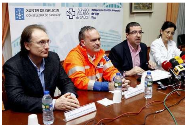
El Sergas presentó su programa para la enfermedad rara. XOÁN C. GIL

El Sergas presentó ayer en Vigo un programa pionero para la asistencia inmediata a pacientes que sufren angioedema hereditario, una enfermedad rara que afecta a 76 personas en Galicia. La gran mayoría se concentran en el área viguesa, de ahí que el Chuvi cuente con experiencia en el tratamiento de esta patología.